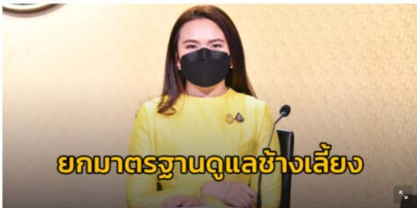
13 มีนาคมรับช้างไทย รัฐบาลผ่านนโยบายให้ความสำคัญเืองการอนุรักษ์ช้างป่า ลดปัญหา ความขัดแย้งระหว่างช้างกับชุมชน ยกมาตรฐานดูแลช้างเลี้ยง ให้การใช้งานในภาคท่องเที่ยว เป็นที่ยอมรับในระดับสากล

เมื่อวันที่ ๘ มีนาคม ๒๕๖๕ คณะรัฐมนตรี ได้อนุมัติหลักการร่างกฎกระทรวง กำหนดมาตรฐานสินค้าเกษตรสำหรับการปฏิบัติที่ดีสำหรับปางช้างเป็นมาตรฐาน บังคับ พ.ศ. .... ซึ่งเป็นการกำหนดเกณฑ์การจัดการควบคุมดูแล และเลี้ยงช้าง ให้ถูกต้องเหมาะสม เช่น สถานที่ตั้งของปางช้างต้องอยู่ในสภาพแวดล้อมที่ไม่เสี่ยง จากการปนเปื้อนของอันตรายทางกายภาพ เคมี และชีวภาพ มีคู่มือการจัดการ ที่แสดงให้เห็นรายละเอียดของการปฏิบัติงาน เช่น การแยกและฝึกลูกช้าง การจัดการ ด้านการสืบพันธุ์ มีสัตวแพทย์ผู้ควบคุมปางช้างกำกับดูแลด้านสุขภาพ และมีการ ตรวจสอบสุขภาพประจำปี โดยให้กฎกระทรวงนี้ใช้บังคับ เมื่อครบกำหนด ๒ ปี นับแต่วันประกาศในราชกิจจานุเบกษา